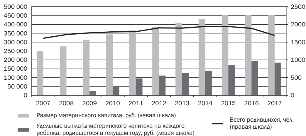
Динамика удельных показателей материнского капитала и количества родившихся / Dynamics of specific indicators of maternity capital and the number of births