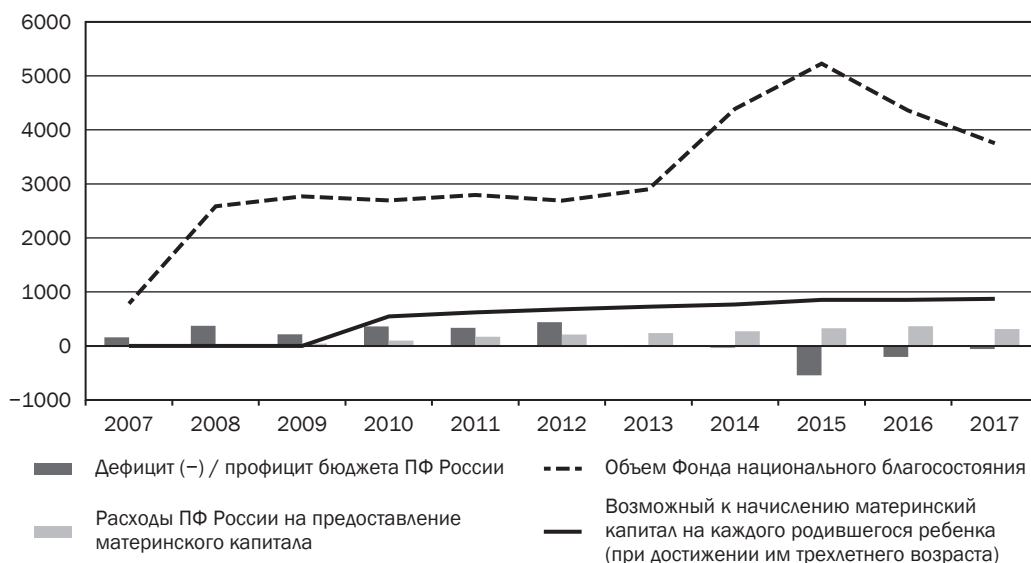
Динамика показателей сбалансированности бюджета ПФ России, объема Фонда национального благосостояния и расходов на предоставление материнского капитала, млрд руб. / Dynamics of budget balance indicators of the Pension Fund of Russia, the volume of the National Wealth Fund and expenses for providing maternity capital, billion rub.